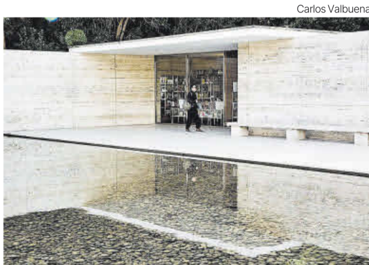
El pavelló Mies van der Rohe de Barcelona, a Montjuïc.

En la presentació d'ahir, abans d'entrar en matèria, reivindicació de Barcelona com a referent internacional en arquitectura i disseny, i com a posseïdora d'un gran patrimoni històric per part dels organitzadors de la cita -ajuntament, Col·legi d'Arquitectes de Catalunya (COAC), Fundació Mies van der Rohe, Barcelona Building i Arquinfad-. Després, desplegament de poder per omplir de contingut la setmana. A destacar entre les novetats, el Festival Internacional de Cine d'Arquitectura de Barcelona (BARQ), l'únic competitiu a Espanya sobre el tema. Tindrà una part presencial, als Cinemes Girona, i una altra online, a través de Filmin.