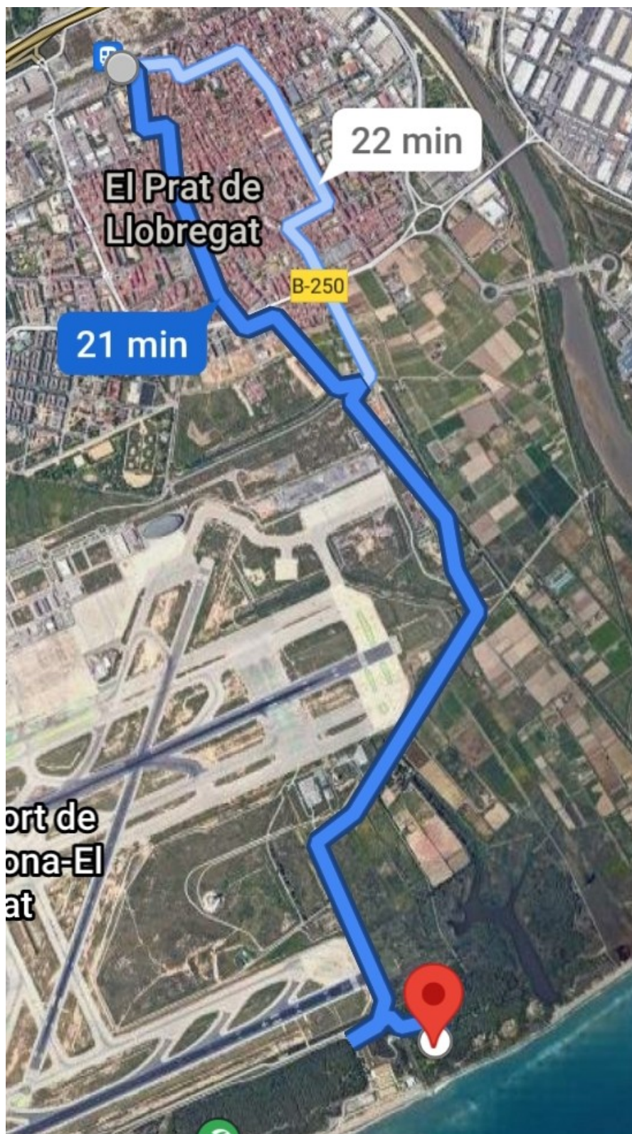
Plànol general des de la Plaça de l'Estació de El Prat de Llobregat a La Ricarda. Distància: 6,2 Km. Temps: 21 minuts en bicicleta.