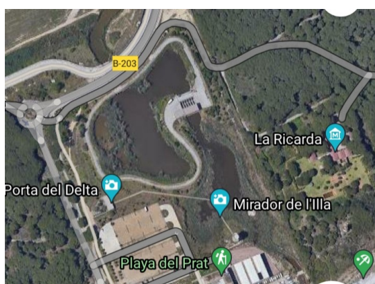
Detall de la zona de La Ricarda.