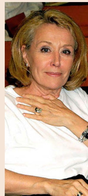
Rosa María Mateo es la elección del Gobierno para dirigir RTVE.

El poeta granadino recibió el Premio Nacional de Poesía en 1995, y fue designado como candidato de Izquierda Unida a la Comunidad de Madrid en 2015.