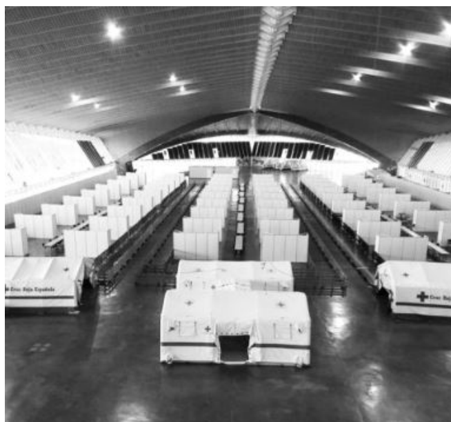
Creu Roja - N'undo

Estudiants de Tecnologies de Baix Cost per a la Cooperació de l'ETSAB han elaborat diverses propostes sobre com adaptar espais de fires - poliesportius per a persones sense sostre o hospitals de campanya.