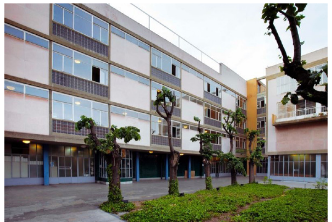
José Hevia | Arxiu Històric COAC

Als inicis del segle XX es crea el Instituto de Higiene Urbana, amb l'objectiu d'afrontar de forma directa aquelles variables que influeixen en l'aparició de malalties epidèmiques. Malgrat els seus esforços de desinfectar, desratitzar i vacunar, la ciutat es va veure afectada per una epidèmia de febre tifoide el 1914. Les últimes grans pandèmies ocorregudes a Barcelona daten del 1918, l'anomenada Grip espanyola i l'asiàtica de 1957. La Generalitat Republicana, en el seu compromís social per la salut pública, inicia l'any 1933 la construcció del