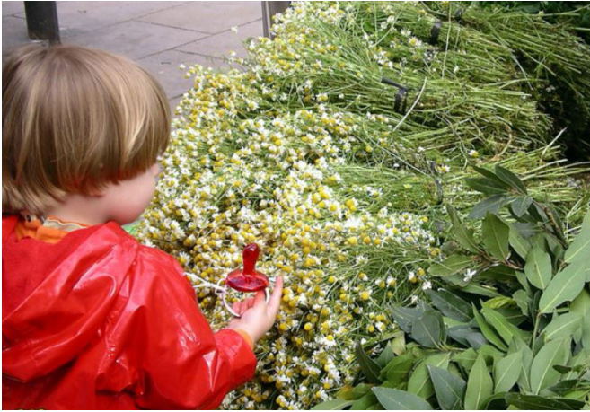
José Gonzalvo Vivas

El Raval era el camp de Barcelona a l'Edat Mitjana, amb els seus horts, i el lloc de la salut (fora dels carrers foscos i atapeïts de l'altra banda de la Rambla). S'hi trobava l'hospital, així com convents, on s'hi cultivaven plantes aromàtiques