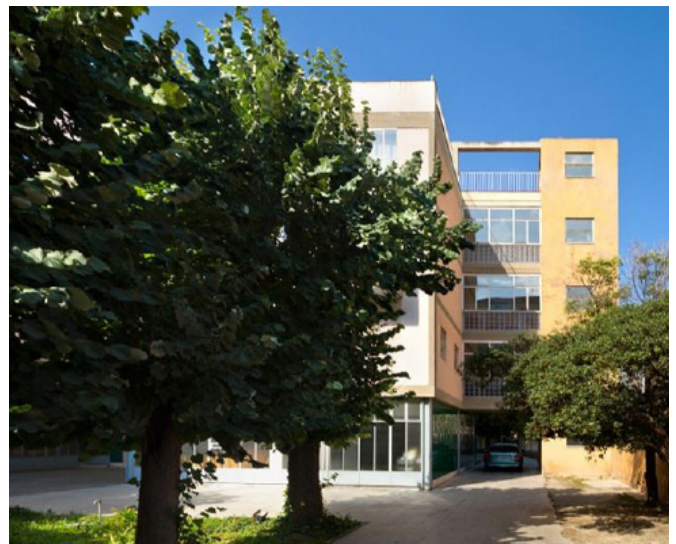
José Hevia | Arxiu Històric COAC

Però aquesta transformació sempre va arrossegar algunes dificultats funcionals, ja que el sanatori original no havia estat pensat per a una afluència gran i contínua de gent, sinó per a tractaments específics. L'accés està mancat d'un bon vestíbul i d'un gran nucli central de comunicació vertical, ja que es va pensar per a usos diversos relacionats amb la malaltia i, per evitar contagis, disposava d'accessos i escales diferenciades. A la vegada, actualment s'ha quedat petit per a les necessitats de la població que té el Raval d'avui.