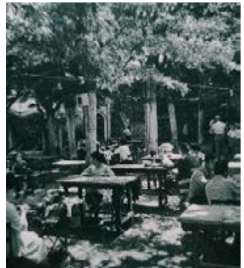
Mapa del Territori al 1861, Fotografia del Passeig de la Font d'en Fargues a l'alçada del Passeig Maragall any 1933, Fotografia fontada any 1962