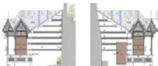
Arquitectura Genís Planelles

Quan es va dur a terme el conjunt de la Font d'en Fargues, a principis del segle XX, era un entorn fantàstic. Es va aprofitar l'aigua que brollava per construir-hi una gruta que sem-