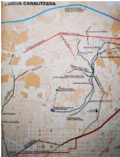
Mapa l'aigua canalitzada. Fons: Atles de l'aigua d'Horta-Guinardó. Cartografia Publicacions El Pou

vés d'una llarga canalització, anava a parar a set fonts públiques de la ciutat. L'any 1703 es va construir una derivació del Rec Comtal des dels molins del Clot fins a l'entrada de la Rambla. Any rere any, la necessitat d'aigua va augmentant amb el creixement de la ciutat, i l'any 1778, es construeix una mina a Montcada per captar aigües subterrànies del Besòs que alimentessin el Rec Comtal.