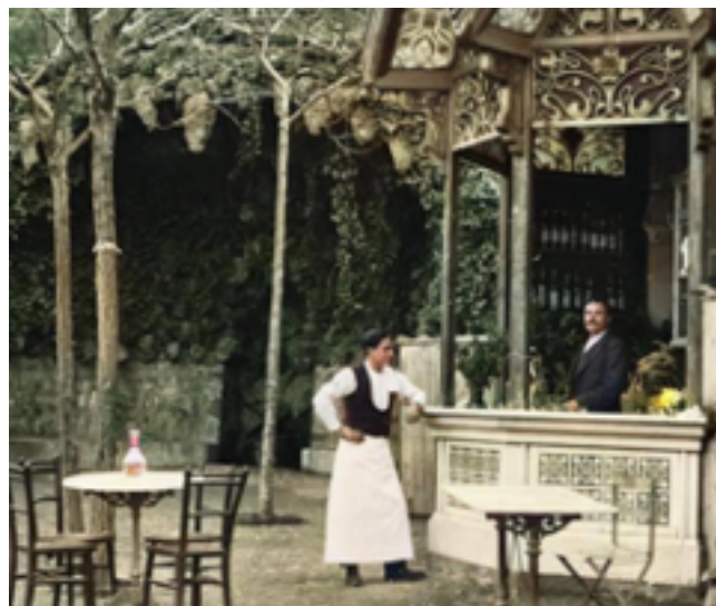
Grup Barcelona Històrica. Autoria desconeguda

A mitjans dels anys setanta s'hi va construir un restaurant que va malmetre l'encant del lloc i gran part del quiosc modernista. Actualment està a l'espera de la remodelació i dignificació de tot aquell espai, amb la font, ara per ara, amagada.