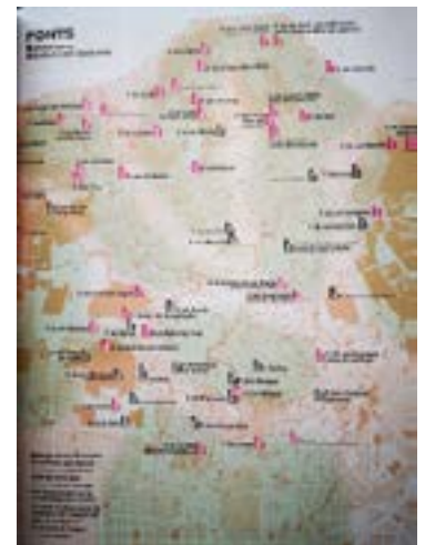
Fonts. Fons: Atlas de l'aigua d'Horta-Guinardó. Cartografia Publicacions El Pou. Fotografia

Prop de moltes restes de fonts s'hi troben parts d'estructures d'aqüeductes, mines, pous i safarejos. Les rentadores no existien fins fa 50 anys, de manera que rentar la roba requeriria molta feina i sobre tot, proximitat fàcil d'aigua. En aquest sentit eren moltes les dones d'Horta que venien cada dia a buscar la roba de les famílies de la resta de barris de Barcelona i la rentaven als Safarejos comunitaris que ressegueixen molts camins de l'aigua. Aquests espais aplegaven moltes dones i es convertien en punts estratègics de cohesió i d'acció feminista.