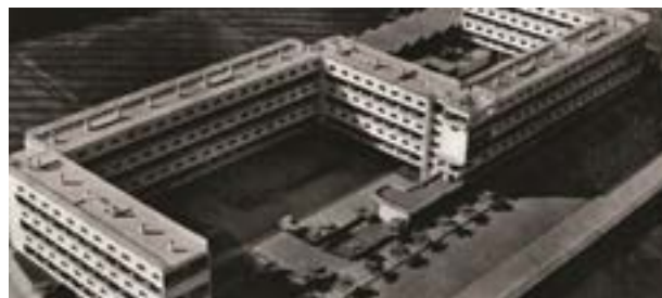
Portada revista AC no.11. Arxiu Històric del Col·legi d'Arquitectes, Fons GATCPAC, AHCOAC. Autoria desconeguda

L'Incasol ja està treballant en aquesta direcció per recuperar la identitat del conjunt.