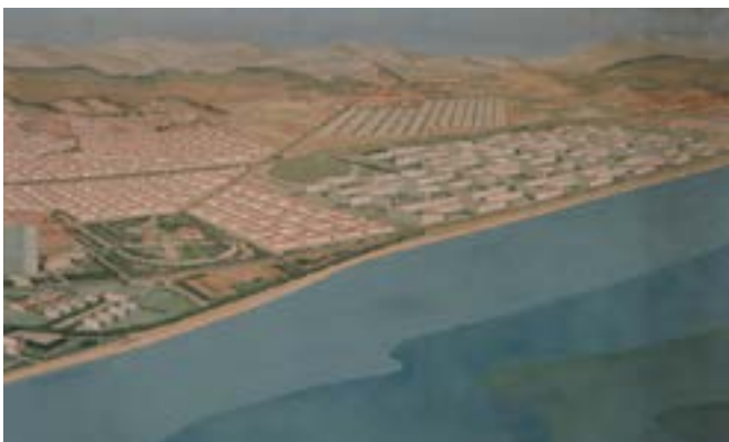
Arxiu Històric del COAC

La Casa Bloc formava part d'un projecte molt més ambiciós de reformulació de l'urbanisme de la Ciutat de Barcelona: el Pla Macià. Aquest projecte s'inspira en les ciutats que Le