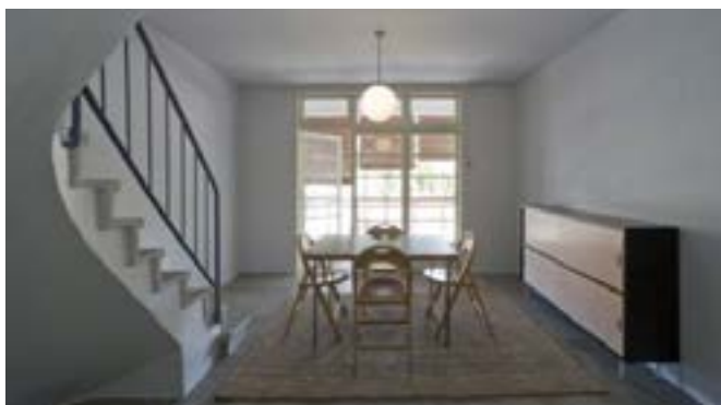
Museu del Disseny de Barcelona

El pis 1/11 s'ha habilitat com a pis-museu i representa l'espai que havien imaginat els arquitectes del GATCPAC en el moment de la construcció de l'edifici. L'edifici està format per habitatges de tipologia dúplex (en dues plantes). L'accés es realitza a través d'una passera comunitària en façana que