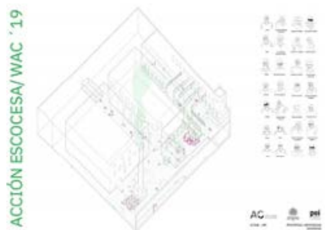
Camara anecoica. (Camara del silenci) Arquitectes de Capçalera

El treball es consolida en contacte directe amb el lloc, els seus habitants i les seves aspiracions. La metodologia de treball sobre l'existent i el contingent comença pel reconeixement de la realitat complexa que s'articula al voltant de cada persona que habita el lloc. Descriu un coneixement que creix de DINS A FORA. El curs pretén seguir projectant una transformació viable i visible del barri, amb un coneixement directe de la realitat social i física. Encara que aquesta segona part del curs, a causa del confinament, s'ha decidit adaptar el treball a l'anàlisi dels habitatges des de cada estudiant i la seva realitat.