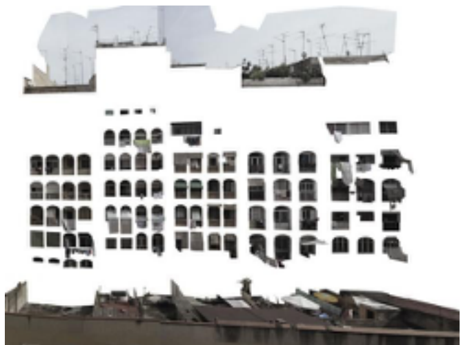
Arquitectes de Capçalera