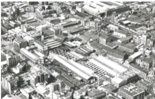
Federació d'Associacions de Veïns i Veïnes de Barcelona

fer que moltes noves indústries s'establissin en l'eixample projectat a Sant Martí. Aquí disposaven d'espai lliure i aigua freàtica a poca profunditat per al procés de producció, així com connexió ferroviària, accessibilitat al port per exportar la producció.