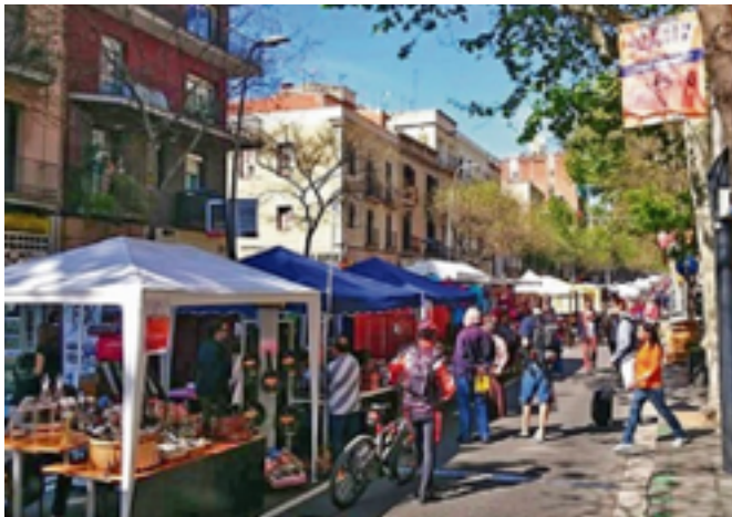
Associació de Comerciants de Creu Coberta