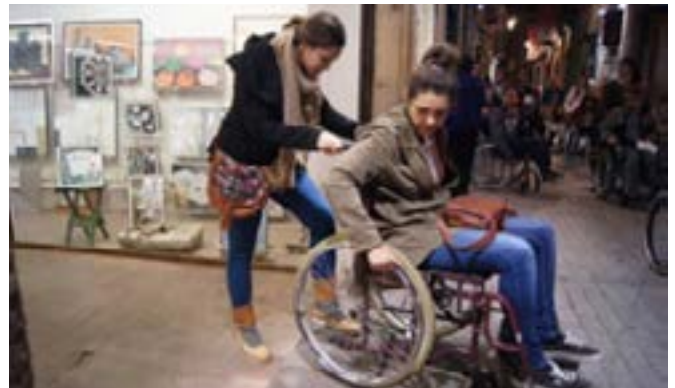
ETSAB – CASBA

Barcelona Sense Barreres és una aplicació mòbil gratuïta que permet rebre informació dels comerços i altres llocs d'interès del barri just quan passes pel davant. L'app és accessible a persones amb discapacitat visual, que d'aquesta manera també poden saber davant de quin establiment es troben i quins productes o ofertes hi ha a l'aparador. És útil per a tothom que vulgui informació del comerç de proximitat i representa, per a aquestes botigues, una nova oportunitat per donar visibilitat a la seva oferta.