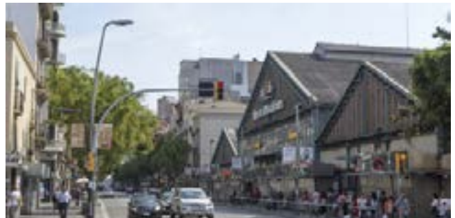
Fotografia propietat de l'Associació de Comerciants de Creu Coberta

Cap a la meitat de la dècada del 1760, per tal de solucionar les comunicacions de la ciutat cap el sud i l'oest, es va construir una nova carretera de Barcelona a Madrid que resseguia l'anterior camí, però completament rectilínia. La carretera de la Creu Coberta es va convertir immediatament en el nou referent, assolint un protagonisme estructural cap al 1850. Des d'aleshores s'hi van començar a instal·lar establiments per tal de donar servei a un camí de la importància de la nova carretera.