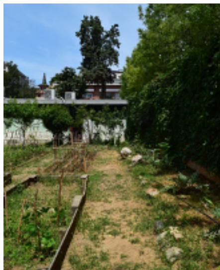
Arquitectes de Sarrià-Sant Gervasi