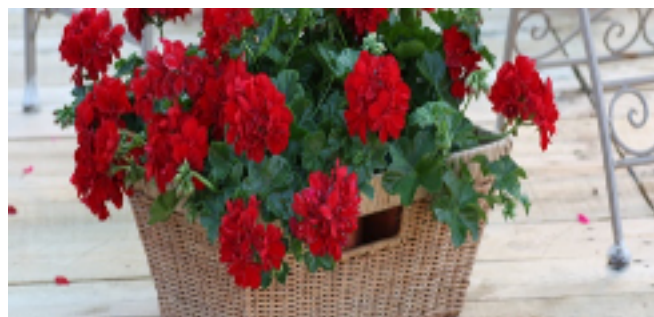
Arquitectes de Sarrià-Sant Gervasi

A partir de 1997, el Grup Roig va desenvolupar, conjuntament amb l'IRTA, Institut de Recerca i Tecnologia Agroalimentàries, una genètica pròpia en geranis que s'ha materialitzat en les sèries "Costa", que engloben les tres espècies ornamentals de gerani. Tenen com a particularitat el fet d'haver estat obtingudes, seleccionades i cultivades en el clima mediterrani i, per tant, són molt més resistents a les altes temperatures. Entre les seves espècies trobem el gerani Costa Barcelona ( Pelargonium grandiflorum ), que necessita poc fred per florir i, per tant, té un període més llarg de floració.