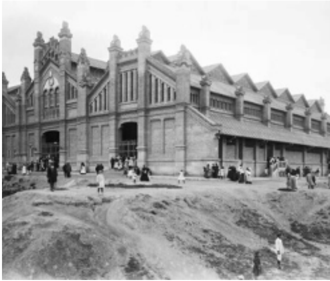
Associació de Comerciants de Creu Coberta

Hi ha botigues clàssiques encara actives com: