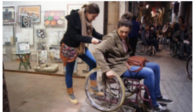
ETSAB – CASBA

Barcelona Sense Barreres és una aplicació mòbil gratuïta que permet rebre informació dels comerços i altres llocs d'interès del barri just quan passes pel davant. L'app és accessible a persones amb discapacitat visual, que d'aquesta manera també poden saber davant de quin establiment es troben i quins productes o ofertes hi ha a l'aparador. És útil per a tothom que vulgui informació del comerç de proximitat i representa, per a aquestes botigues, una nova oportunitat per donar visibilitat a la seva oferta.