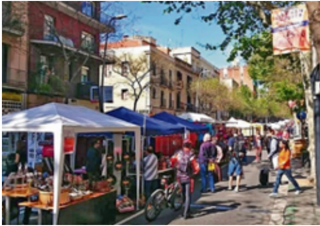
Associació de Comerciants de Creu Coberta