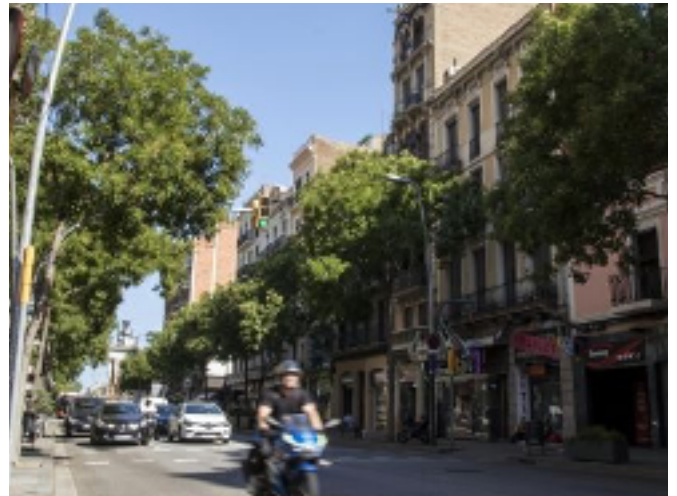
Associació de Comerciants de Creu Coberta