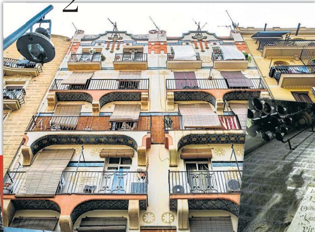
01. Casa Planells. 02. Casa Heras i Llobet. 03. Finca Sansalvador. 04. Làpida de santa Joaquina Vedruna a la basilica de Santa Maria del Pi. PERE VIRGILI 05. Una fotografia de la façana de la botiga Mañach, al carrer de Ferran, enriquida per Jujol. ARXIU JUJOL