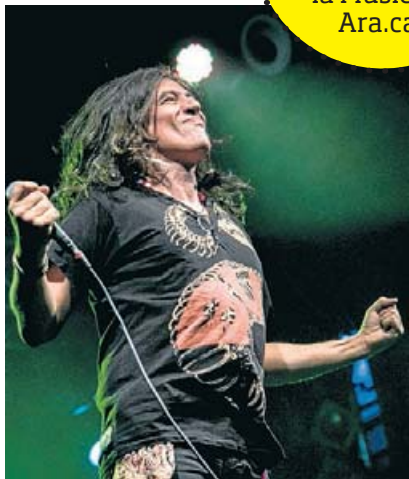
Gerard Quintana durant un concert dels Sopa.

La Nit de l'ARA Les entrades per al concert de Sopa de Cabra al Palau de la Música, a Ara.cat