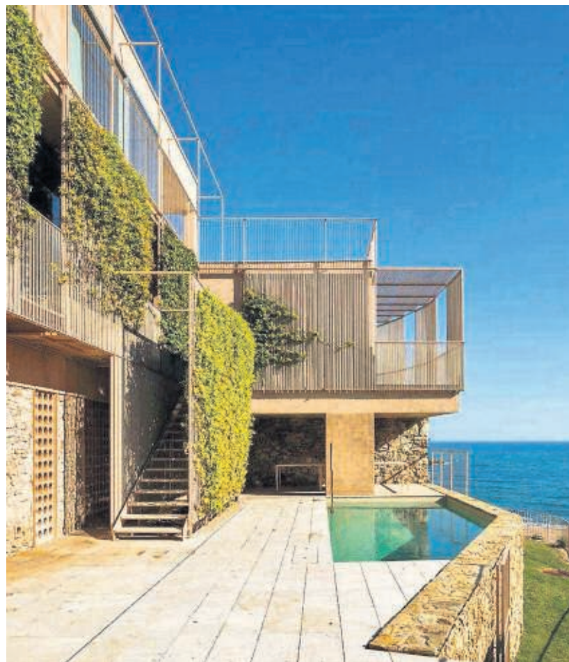
Quatre de les joies del llibre: a la portada, la transformació urbana de l'entorn de la Seu Vella de Lleida, amb l'edifici dels jutjats a la muralla. A dalt, una vista del polígon de Bellvitge. Al centre, la Casa Gomis (La Ricarda) al Prat de Llobregat, i la Casa Bastida, a Begur.

derch i Josep Maria Sostres. L'arribada de la immigració interna d'Espanya a les grans ciutats, entre elles Barcelona, es va resoldre amb la proliferació dels suburbis, que en el llibre es defineix com “l'arquitectura sense arquitectes”.