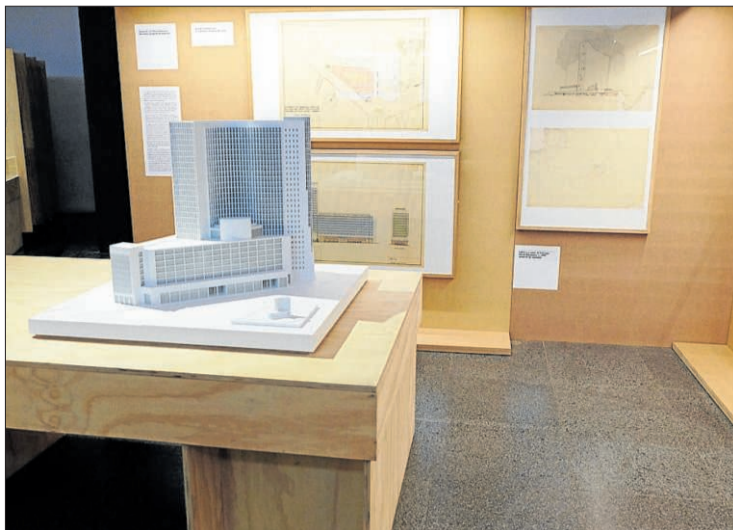
Foto d'una maqueta d'una obra de l'arquitecte gironí.