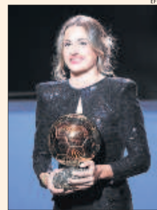
La futbolista Alexia Putellas