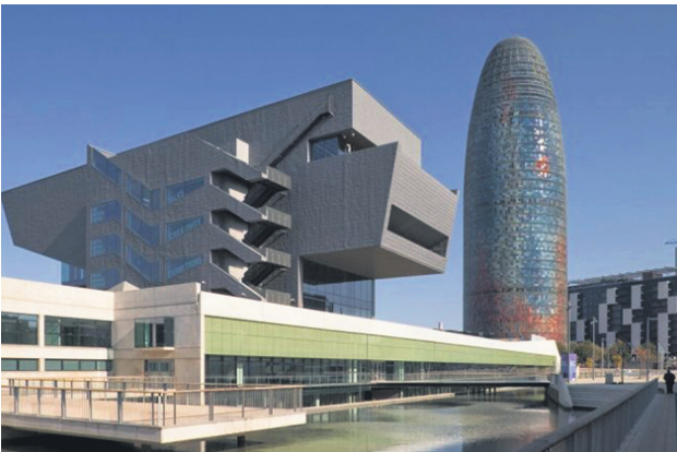
El Disseny Hub Barcelona también lleva su sello.