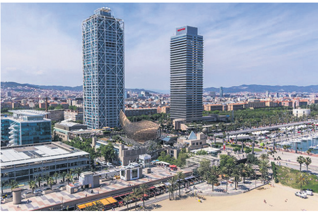
La Vila Olímpica, una de sus obras con más proyección.