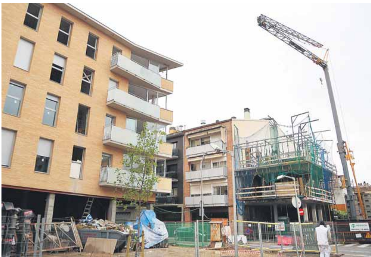
Un bloc d'habitatges de nova construcció, en aquest cas iniciat ja en plena crisi

Habitatge El futur incert dels pisos i cases en construcció aturats per la crisi