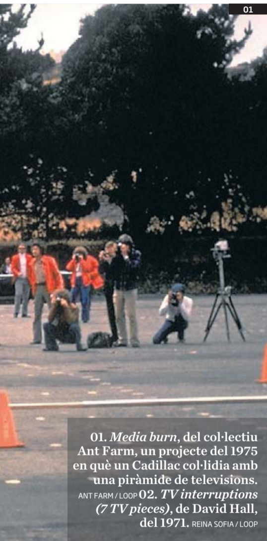
01. Media burn , del col·lectiu Ant Farm, un projecte del 1975 en què un Cadillac col·lidia amb una piràmide de televisors. 02. TV interruptions (7 TV pieces) , de David Hall, del 1971.

Els cadenats de l'amor que omplien el Pont de les Arts de París per culpa de la novel·la Tinc ganes de tu s'han venut per més de 250.000 euros. L'Ajuntament els ha subhastat i ha donat els beneficis per als refugiats.