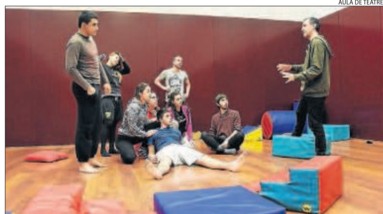
Una classe del cicle formatiu de Tècniques d'Actuació Teatral.