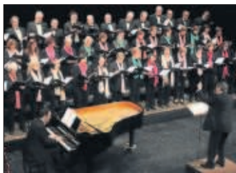
Polifònica de l'Urgell.

Entrades: www.teatredelallotja.cat . • A taquilla (dimarts, dimecres i dijous, d'11 a 13 h; de dilluns a divendres, de 17 h a 21 h; dissabtes de funció de 17 h a 21 h, i diumenges i festius, des d'1 hora abans de la funció) i Oficina de Turisme de Lleida .