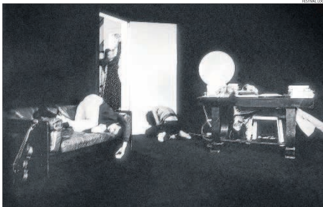
'Primera mort', d'un col·lectiu en el qual participava l'artista lleidatà, reviurà al Festival Loop.