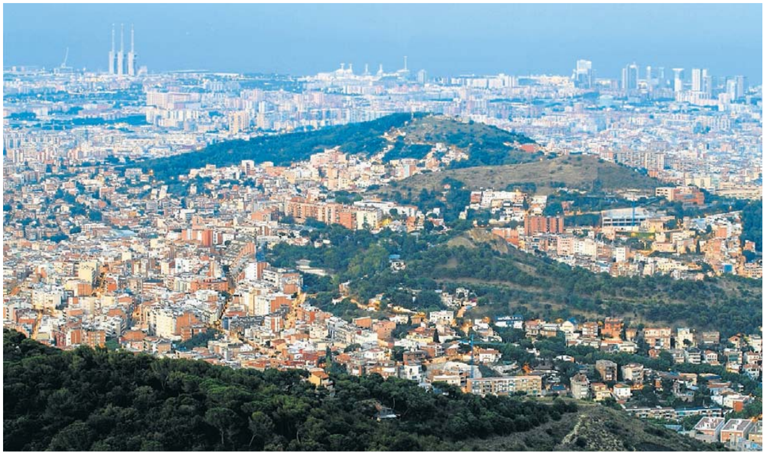
El barri del Carmel de Barcelona és un dels llocs on s'aixecarà una de les quatre promocions de la Generalitat.

El concurs tindrà dues voltes. A la primera es triaran vuit candidats per la seva capacitat i solvència, mentre que a la segona un comitè d'experts farà una valoració de cadascun dels projectes. Al comitè hi haurà representants del Col·legi d'Arquitectes, de l'Associació de Gestors de Polítiques Socials d'Habitatge de Catalunya, de l'Institut de Tecnologia de la Construcció de Catalunya i de l'ajuntament pertinent. D'altra banda, el conseller Jo-