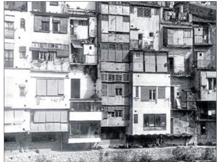
Contrast entre la Girona viva i de colors i la Girona grisa i negra. ► La nova façana de l'Onyar, executada el 1983, va contribuir a la transformació de Girona, també econòmica. ANIOL RESCLOSA