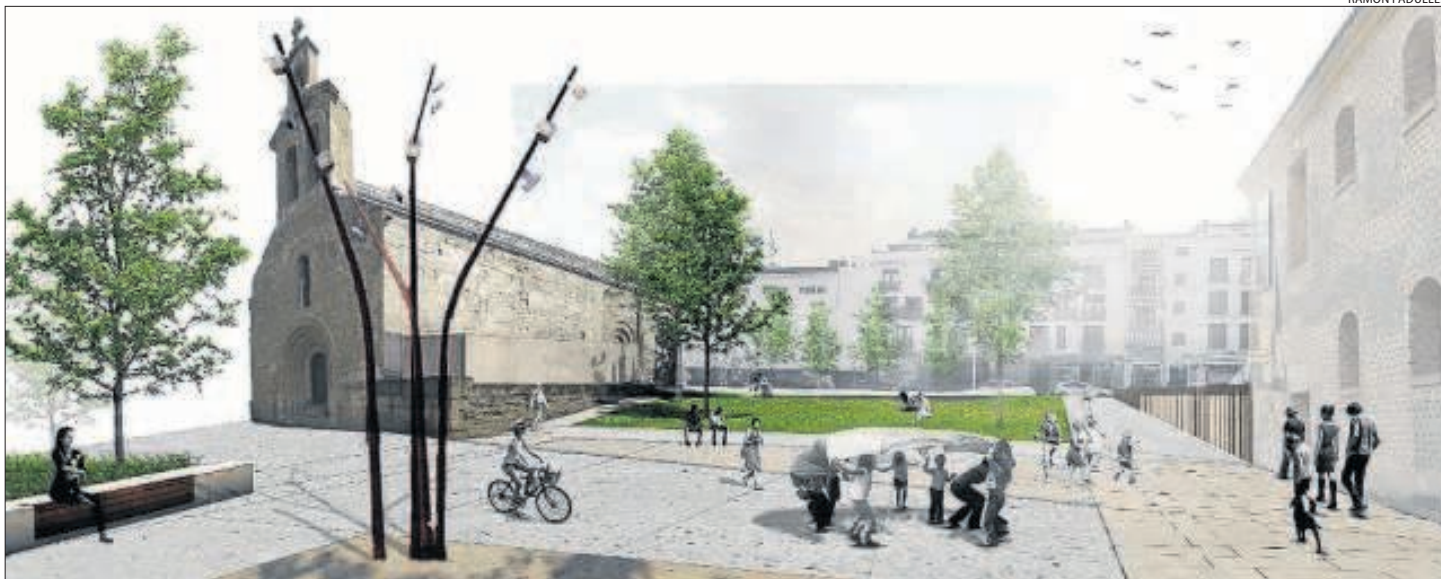
El projecte de Padulles preveu una plaça que integri els equipaments culturals del seu entorn.

■ L'arquitecta Isabel Bennasar proposa crear un nou accés per a vianants al Turó de la Seu Vella de manera que es creï una relació visual i física entre el Turó i l'Auditori. El carrer la Parra s'incorpora a la plaça i serà de calçada única amb prioritat per a vianants. El carrer Pi i Margall també formarà part de la plaça. Els arbres, al seu torn, serviran com a element de connexió entre espais.