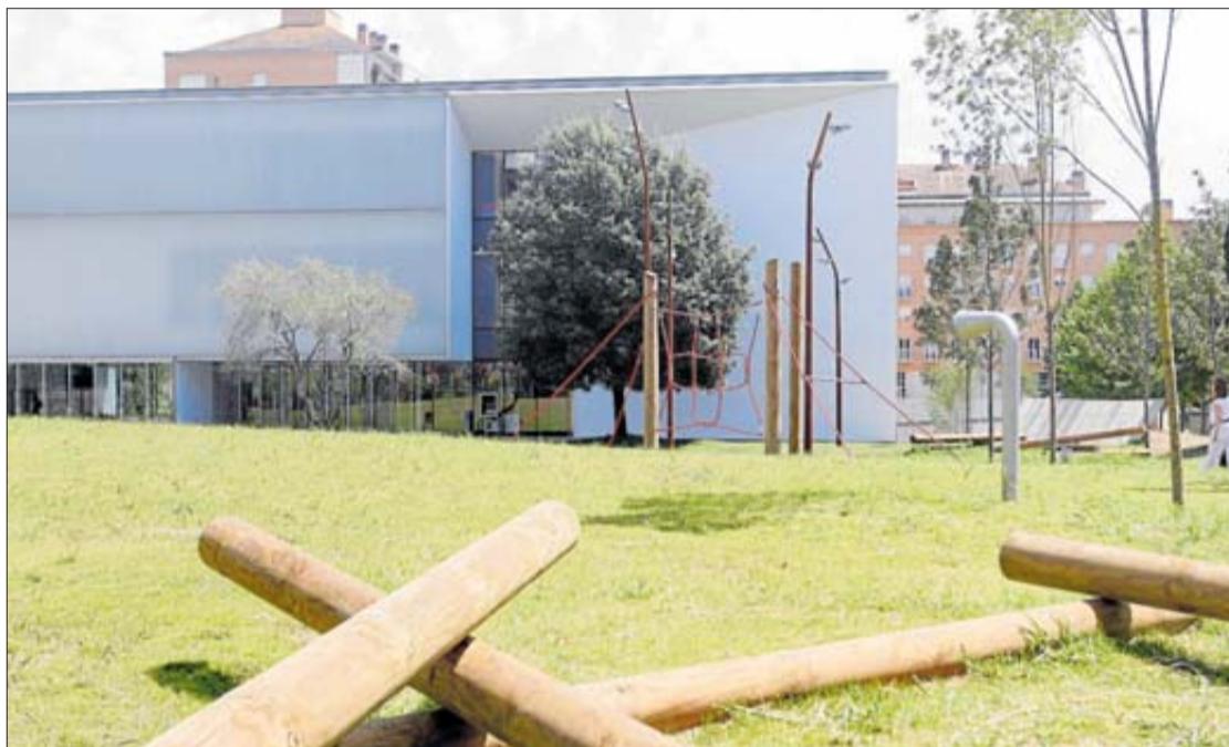
La biblioteca Carles Rahola de Girona, al carrer Emili Grahit. MARC MARTÍ

Mentrestant, la Generalitat, admet que el contracte de l'empresa que s'havia contractat per oferir el servei de l'hora del conte de la Bi-