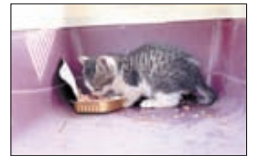
Uno de los gatos que pudo ser rescatado

Todos ellos declararon ante los agentes, que les informaron de que pondrán los hechos en conocimiento del Juzgado. Las protectoras consideran "muy grave" que el pasado jueves se