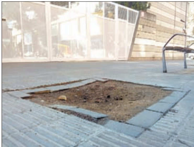
La zona de tierra sin árbol convertida en un pipican

La Escola Bressol de la Bordeta tiene delante de su entrada de la calle Hostal de la Bordeta un improvisado pipican en un alcorque de un árbol talado hace tiempo. Eso es así porque uno o varios vecinos incívicos aprovechan la pequeña zona de tierra donde se plantan árboles para que sus mascotas hagan sus necesidades. De hecho, al menos hay dos zonas donde acostumbran a acumularse las heces caninas: una frente a la puerta de acceso de la llar d'infants , donde esperan los padres la salida de los niños y, la otra, en la acera de enfrente. Desde hace años hay varios alcorques (huecos para plantar los árboles) que están vacíos y mucha gente también los usa como papelera o cenicero. En definitiva, la entrada de la escola bressol , que debería ser un punto de limpieza impecable, suele ofrecer mala imagen. La asociación de vecinos de la Bordeta lleva años promoviendo campañas para denunciar la suciedad relacionada con los perros.