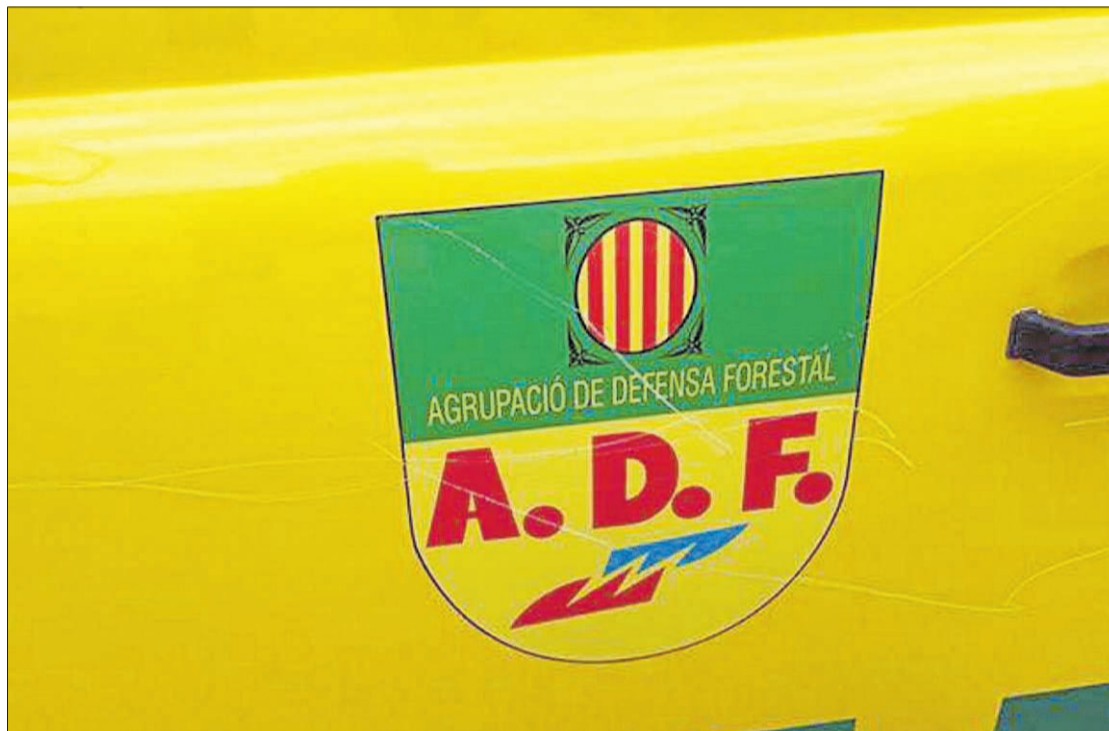
Els cotxes de l'ADF de la Selva Marítima van patir ratllades a tot el xassís.

El canvi va ser aprovat pel consistori i per la majoria de membres de l'assemblea de veïns, ja que les instal·lacions també són utilitzades per l'Associació veïnal de Roca Grossa. «Quan ens vam instal·lar vam pintar i arreglar l'entorn, que estava molt abandonat, però per poder fer-lo operatiu vam haver de talar un pi que estava malalt», va especificar el representant dels forestals. Una actuació que no va agradar a alguns dels veïns, que van acusar els mem-