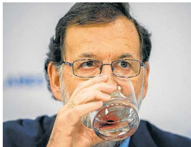
El president del govern, Mariano Rajoy, ahir a la seu del Partit Popular.

La xifra serà "superior" a aquest 1%, va dir Rajoy, tot i que depèn del suport d'altres grups parlamentaris,