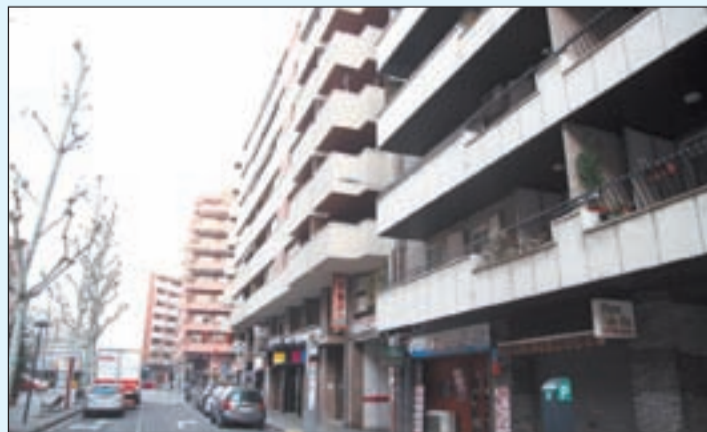
Imatge de pisos del carrer Doctora Castells de Lleida

Tot hi l'augment d'habitatges, els preus no disminueixen. En aquest sentit, Lleida ciutat a