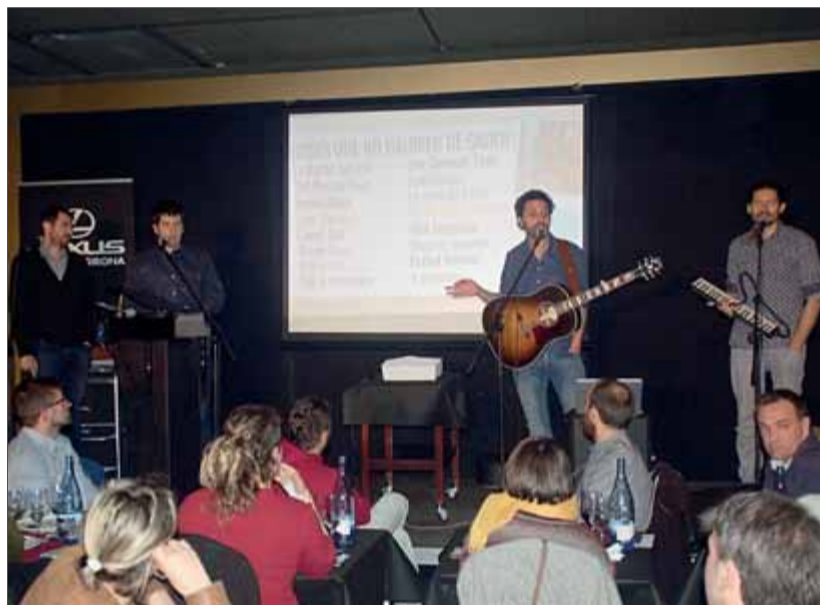
Els Amics de les Arts, divendres al Festimams ■ X.C.

Això es va fer molt evident divendres a la gran sala del restaurant Lotus Blau de l'Hotel Balneari Termes Orion de Santa Coloma de Farners, completament plena per assistir a la segona nit del Festimams El Xitxarello. Aquest festival d'humor i gastronomia vol anar més enllà del típic monòleg amb propostes com una nit amb Els Amics de les Arts en què el grup gairebé no va cantar -Ciència ficció- , dedicada a una noia del públic que feia 20 anys, Jean-Luc com a cloenda, i poca cosa més- i sí va explicar moltes anècdotes, com en les primeres gires, quan la falta de repertori es compensava amb llargues i parateas