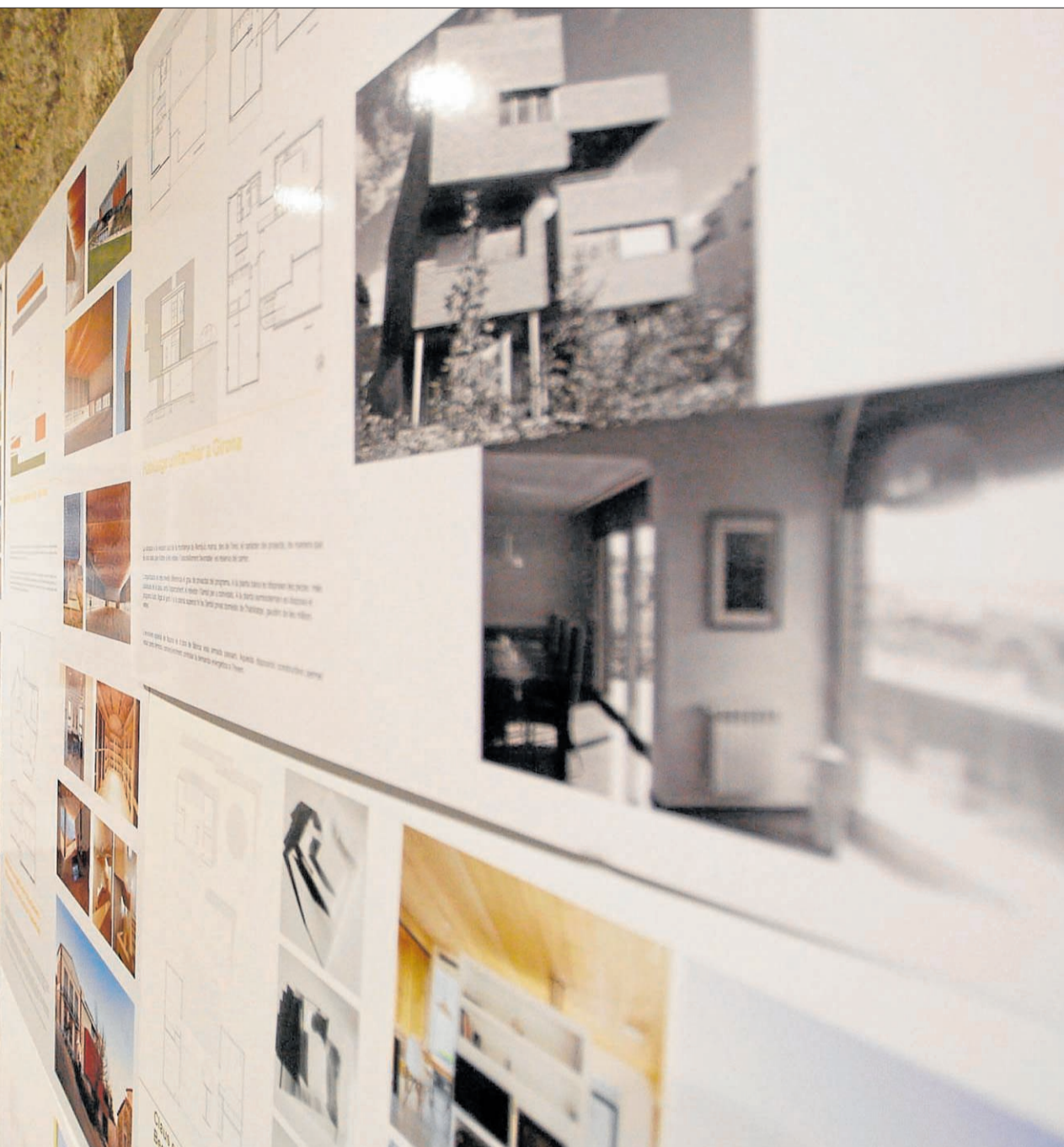
L'edifici Pia Almoina de Girona, la seu del COAC a la província gironina. MARC MARTÍ