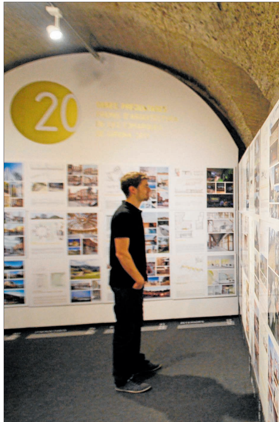
Les 91 obres presentades als premis es poden visitar a la sala La Cova de

Per celebrar els 20 anys, l'exposició de les obres seleccionades viatjarà per tota la demarcació de Girona