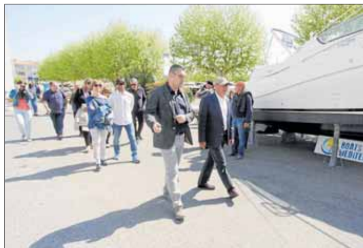
Dissabte va obrir les portes la Fira del Vaixell d'Ocasió. ROSANA VIDAL

està arrencant amb bones perspectives i el primer cap de setmana ja s'havien tancat més d'una desena de contractes, la qual cosa fa pensar que aquest pot ser un molt bon any. El 2017 és l'any dels Milla Zero. El mercat d'ocasió ha tingut bona salut en els darrers anys i ha reduït les unitats d'embarcacions de segona mà que tenien les nàutiques en estoc propiciant la venda de vaixell nou i és per això que, en aquesta ocasió, a Empuriabrava, s'hi podran veure moltes embarcacions noves o seminoves. La Fira és oberta al públic fins al 16 d'abril de 10 del matí a 7 de la tarda, amb entrada gratuïta.