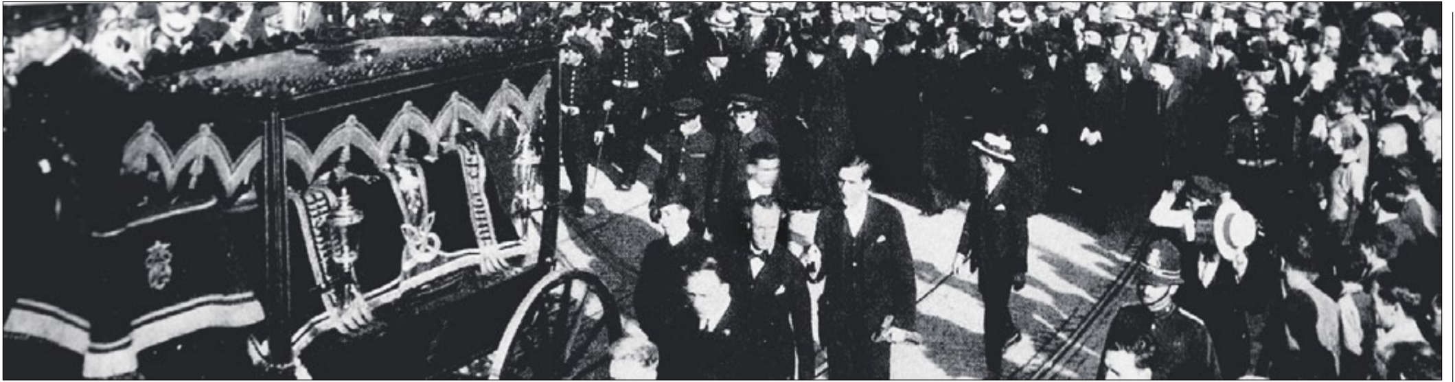
▶ Cotxe mortuori amb el drap púrpura que cobria el fèretre d'Antoni Gaudí en el multitudinari seguici funerari que va recórrer el centre de Barcelona el 12 de juny de 1926.