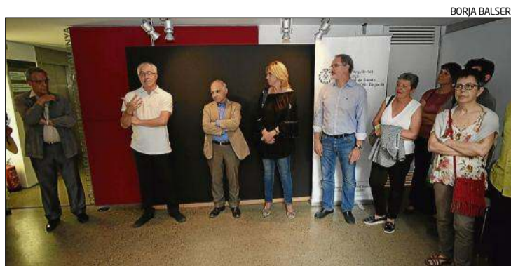
L'acte de celebració que es va fer ahir al vespre.

D'altra banda, la celebració va servir també per a inaugurar una altra exposició, la dels Premis d'Arquitectura de les Comarques de Girona 2016. En aquest cas, la mostra recull 16 projecte seleccionats. Entre ells, s'hi poden veu-