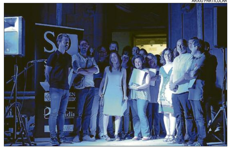
Liurament de les mencions

D'altra banda, l'Orfeó Berguedà ja ha començat els assaigs dels cants per als oficis del dia 3 i 8 de setembre dins de la celebració del centenari de la Coronació. Fonts de l'entitat han informat que «s'ha fet extensiu a totes les formacions corals del Berguedà que vulguin hi participar també per cantar plegats l'himne de la Coronació, que serà cantat el dia 27 d'agost, en el precís moment que la imatge de la Mare de Déu de Queralt farà entrada a la plaça Sant Pere».