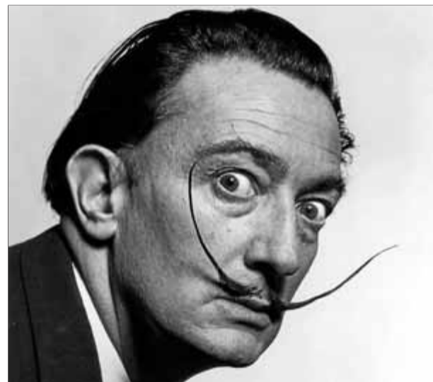
Un dels retrats de Halsman a Salvador Dalí

També es posen a la venda vora de mil entrades en línia al dia de tarifa única a 14 euros, per entrar de nou a dos quarts de deu del matí o bé de cinc a dos quarts de set de la tarda, que inclouen l'espai Dalí Joies. ■