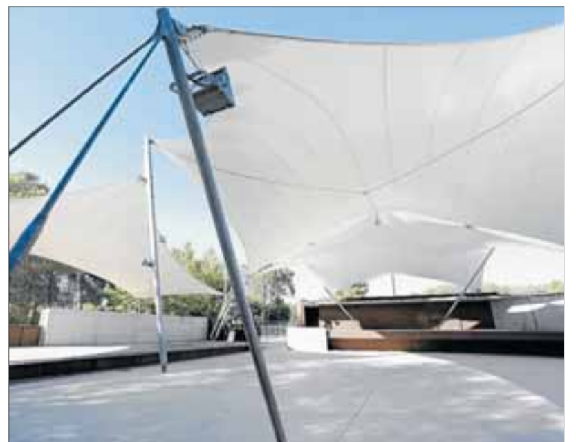
Imatge de la pista de ball i l'escenari per a concerts i actuacions.

Va obtenir el premi d'espais exteriors a la biennial del Col·legi d'Arquitectes