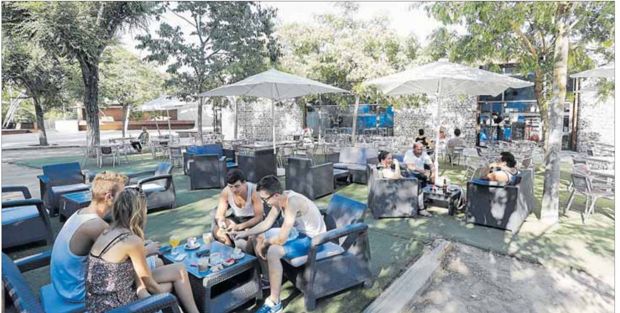
Imatge d'una de les zones d'oci del Parc de la Torre d'en Guiu del Catllar, un dels racons més vius del municipi que acull un gran moviment de veïns i propostes culturals.