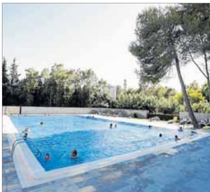
La piscina municipal és un dels atractius de l'estiu.

L'Ajuntament va adquirir la zona lúdica de la Torre d'en Guiu l'any 1998, fins aleshores de titularitat privada i destinada a l'activitat de càmping. L'objectiu era adequar-la i destinar-la a zona esportiva i d'esbarjo de la població, atenent a la idoneïtat del seu emplaçament—annex al nucli urbà i amb facilitat d'ac-