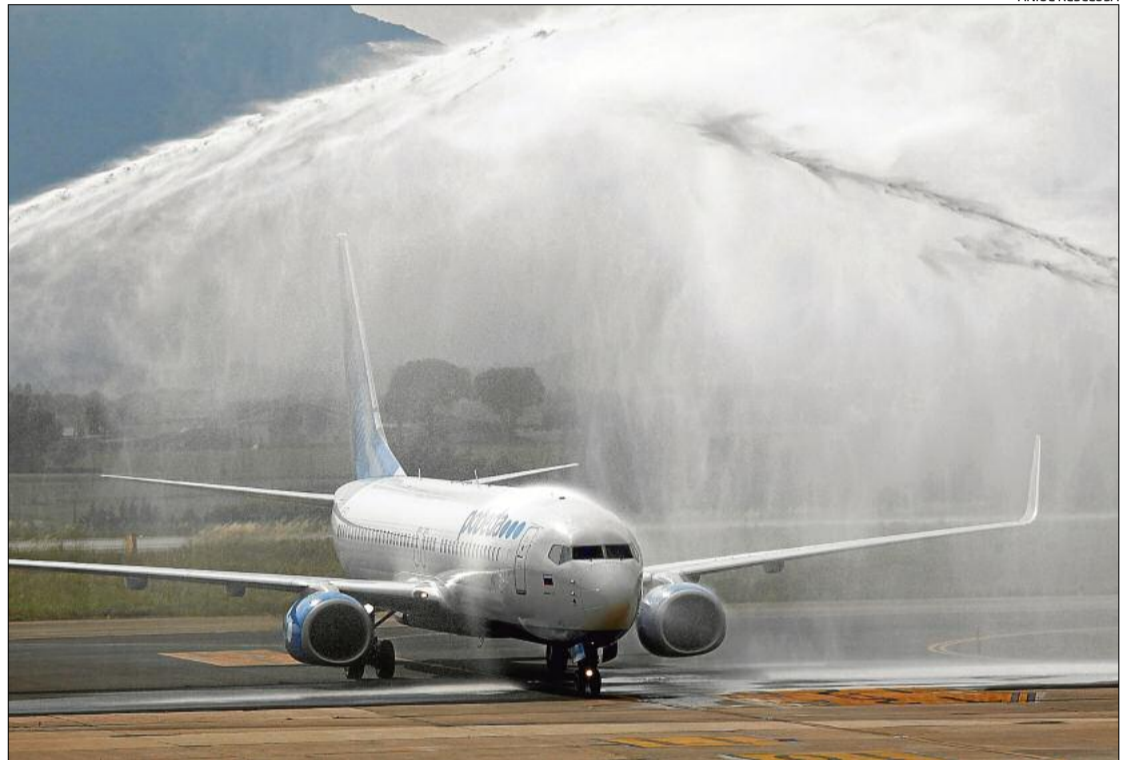
El primer avió de Pobeda que va aterrar a l'aeroport de Girona, el mes de juny passat.

apareixent i desapareixent durant els últims anys a l'aeroport de Girona. L'any 2011, la desapareguda companyia Transaero va començar les seves operacions, que es van allargar fins al 2013 i es van interrompre de forma sobtada quan semblava que el vol s'havia con-