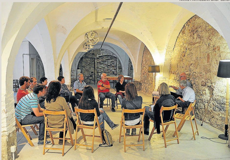
Reunió de treball del projecte Sota la Pell del Rec del grup Cerca