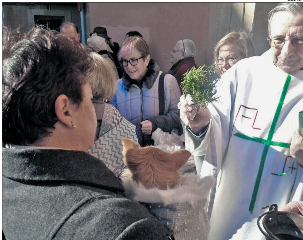
Després de la missa, els presents van sortir a la plaça per beneir els seus gossos.