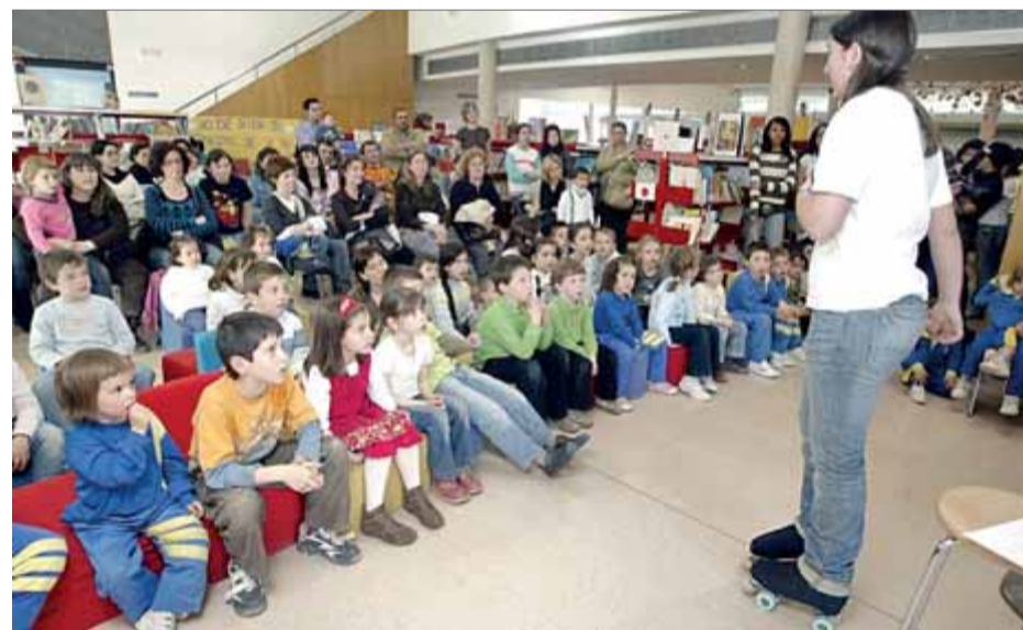
Una alumna de secundària explica un conte en una biblioteca, en una imatge d'arxiu

L'objectiu de la iniciativa és promoure la cohesió social, la interculturalitat i l'ús social del català a través de la millora de l'expressió oral i escrita i també l'autoestima reforçant