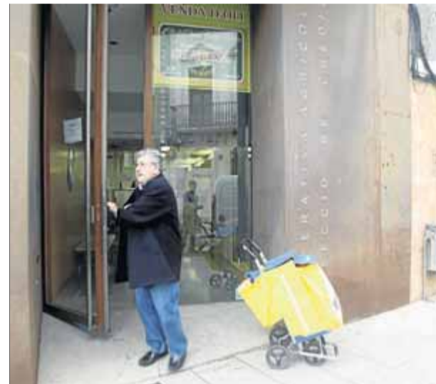
Oficines de la secció de crèdit de la cooperativa de la Canonja, ahir al matí ■ JUDIT FERNÁNDEZ

■ Sense liquiditat, la secció de crèdit decideix restringir els reintegraments