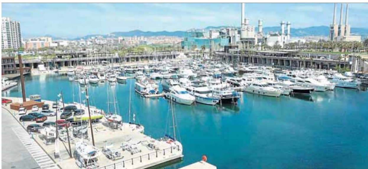
Imatge actual del Port Fòrum, que va rebre els primers vaixells ara fa dotze anys.