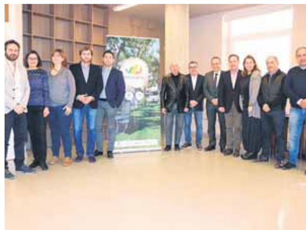
Acte de constitució de la nova confederació, en el Girocamping ■ ASSOCIACIÓ DE CÀMPINGS

els dos territoris sumen el cent per cent dels Best Campings espanyols, els premis internacionals concedits a Alemanya i Holanda, i són líders en ocupació tant a l'estiu com a l'hivern. Els representants de les dues associacions van assegurar que aquesta suma