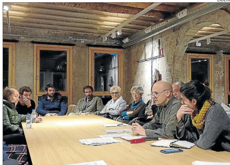
La comissió que ha triat els arquitectes que han de pensar el Rec