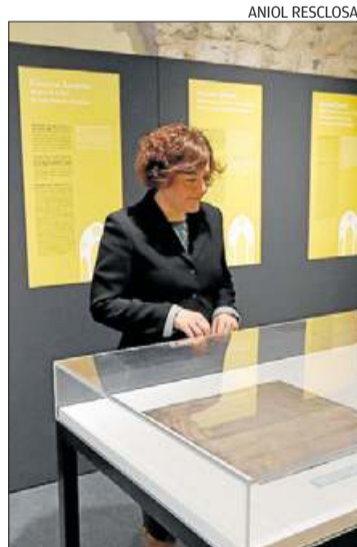
L'exposició del pergamí.

Aquella aposta permet avui a Girona tenir una catedral excepcional i admirada, i presumir de la volta gòtica més ampla del món en un edifici religiós.