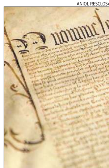
Detall del valuós pergamí.