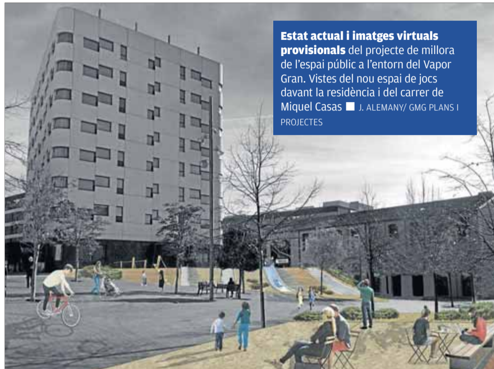
Estat actual i imatges virtuals provisionals del projecte de millora de l'espai públic a l'entorn del Vapor Gran. Vistes del nou espai de jocs davant la residència i del carrer de Miquel Casas