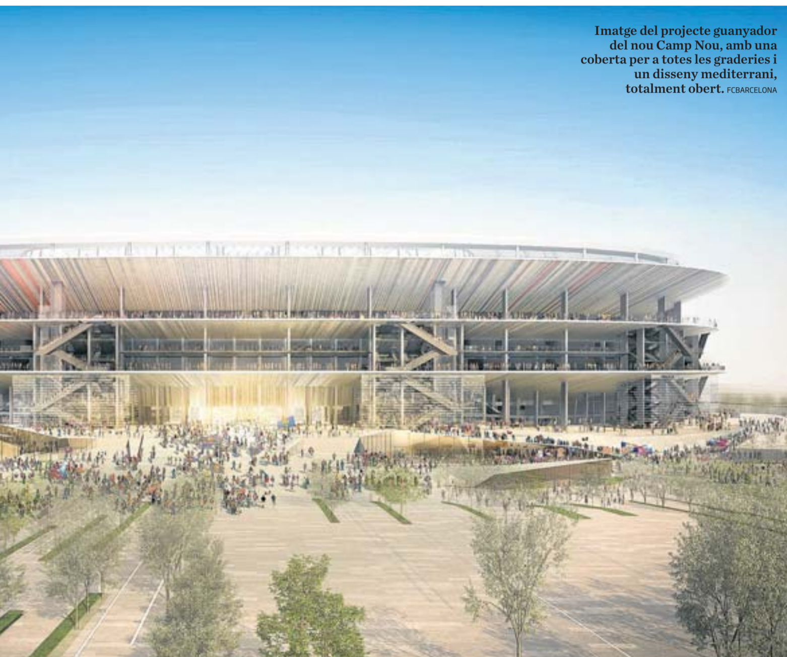
Imatge del projecte guanyador del nou Camp Nou, amb una coberta per a totes les graderies i un disseny mediterrani, totalment obert.

En el marc del Dia de les Dones, el Barça va fer d'amfitrió de la primera reunió del Comitè de Futbol Femení de l'Associació de Clubs Europeus, l'ECA. Fins a 55 representants dels 35 principals clubs del continent van trobar-se a la Ciutat Esportiva Joan Gamper en una jornada de treball per intentar trobar la manera d'impulsar el futbol femení durant els pròxims anys.