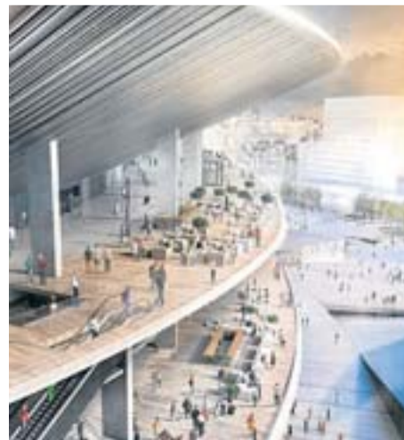
El nou estadi serà obert, sense una façana rígida. FC BARCELONA

L'estiu del 2014, el Barça va fitxar l'home encarregat de dirigir la construcció de la