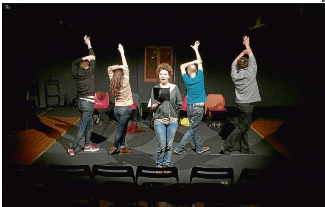
Un assaig de l'obra a la sala La Planeta.

Joanmiquel ha barrejat escenes d' Alejandro y Ana amb fragments biogràfics dels membres d'Animalario, que van escriure un diari on confessen els seus sentiments i les seves pors en un moment que no van ser precisament