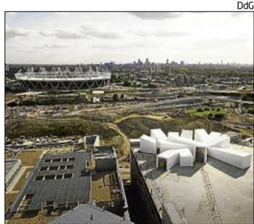
Un projecte de Carmody Groarke.

La seu gironina del Col·legi d'Arquitectes de Catalunya (COAC) inaugurarà avui (19.30 h) l'exposició Making Work , de Carmody Groarke Studio, un reconegut despatx d'arquitectura de Londres. L'exposició es duu a terme dins el Cicle La Cova. Sobre la Tècnica , programat pel Departament de Cultura de la Demarcació de Girona del COAC.