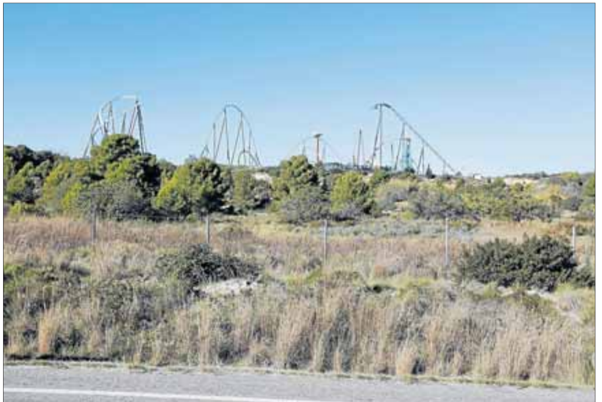
El macrocomplejo de casinos, hoteles y comercios está previsto junto a PortAventura.

En el Ayuntamiento de Vila-seca, por su parte, inciden en que «no hay paralización ni marcha atrás, que nadie se alarme». Y destacan en que es una inversión «importantísima para el territorio».