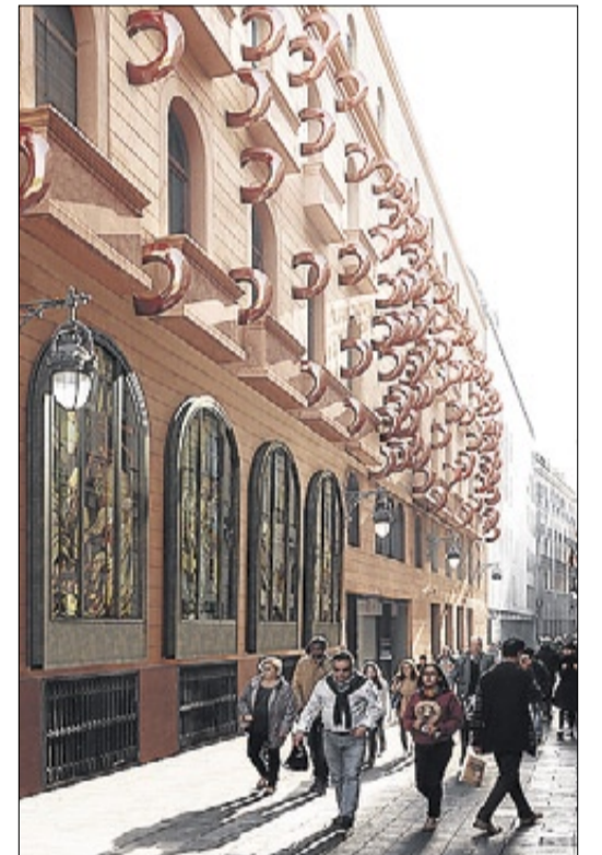
► El projecte d'Amat per al Liceu.

En el passat el Liceu ha pogut fer coses malament però, per exemple, va posar a concurs, com ha de ser, la decoració del sostre de la sala (que va guanyar Perejaume ), com bé sap el mateix Amat , que s'hi havia presentat. Ara no hi ha hagut concurs per a una intervenció de gran calat urbà en un frontis situat en un dels llocs privilegiats de Barcelona com és la Rambla. Es tracta a més d'una façana que no permet gaires canvis pel fet d'estar qualificada com a bé cultural d'interès nacional.