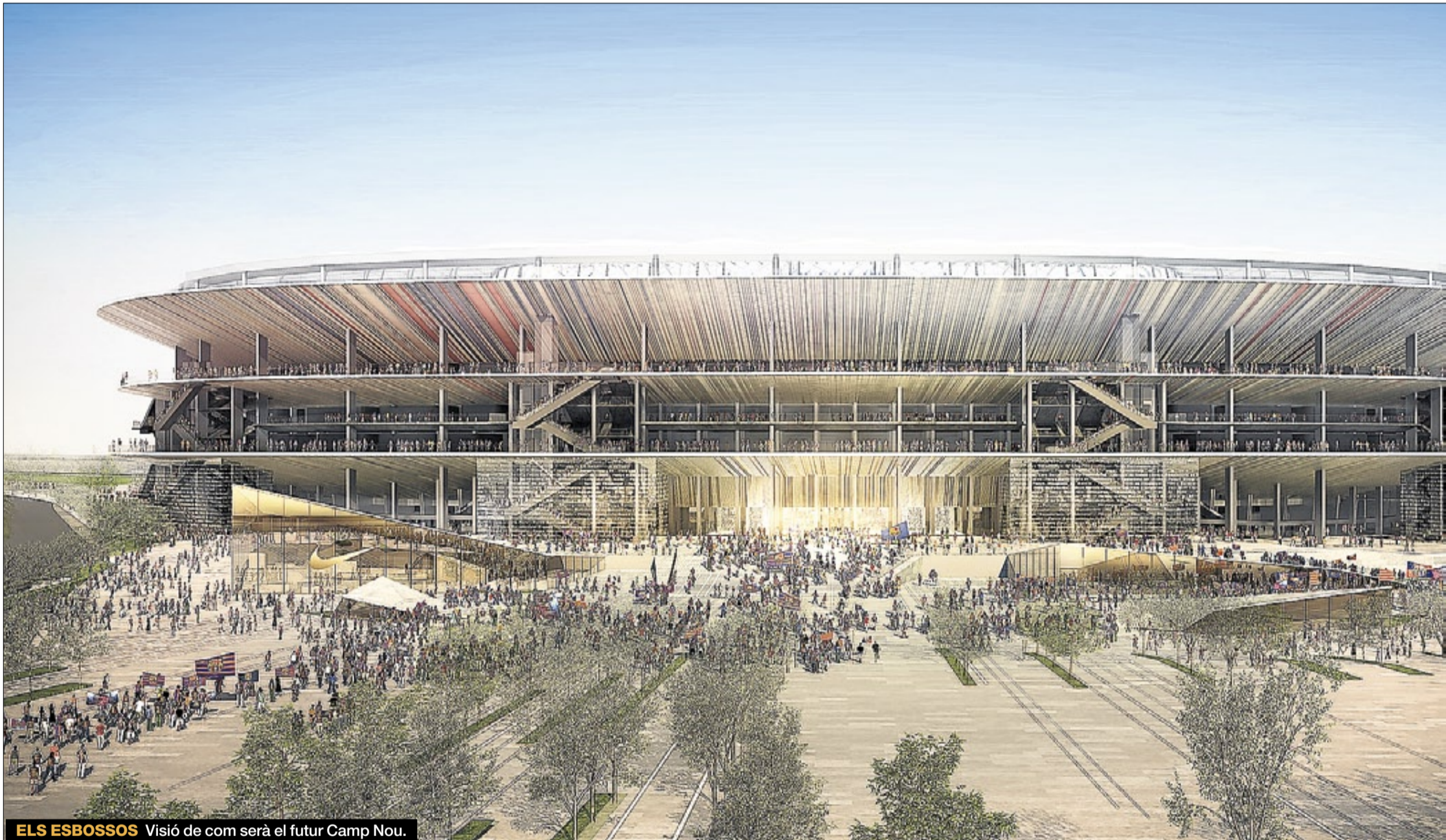
ELS ESBOSSOS Visió de com serà el futur Camp Nou.

L'actualitat blaugrana ▶ El projecte del futur estadi