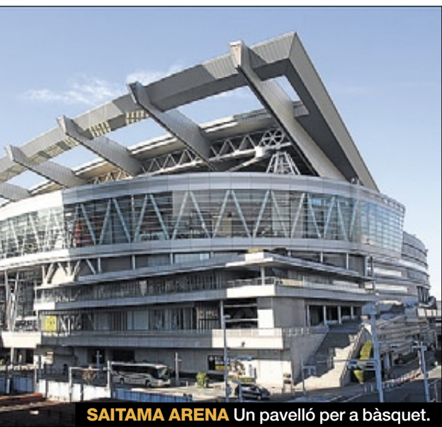
SAITAMA ARENA Un pavelló per a bàsquet.