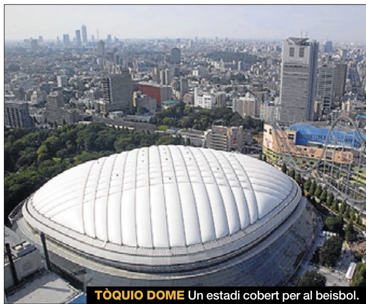
TÒQUIO DOME Un estadi cobert per al beisbol.