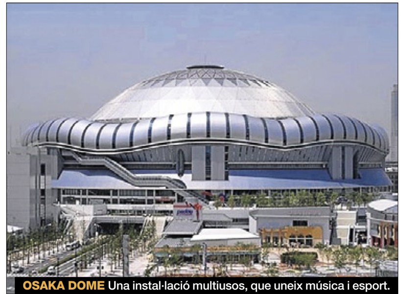
OSAKA DOME Una instal·lació multiusos, que uneix música i esport.