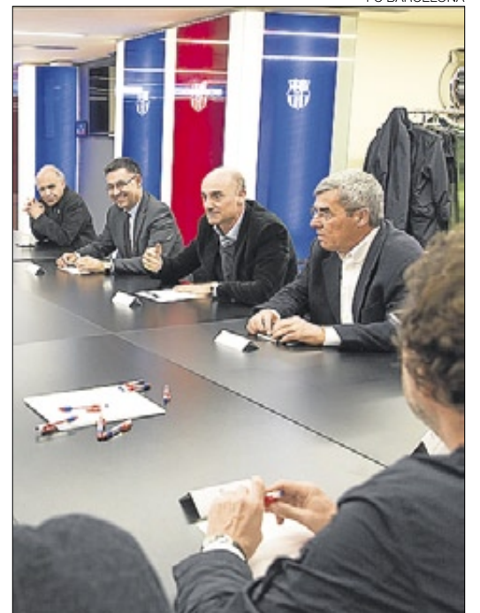
▶▶ El jurat de l'Espai Barça.