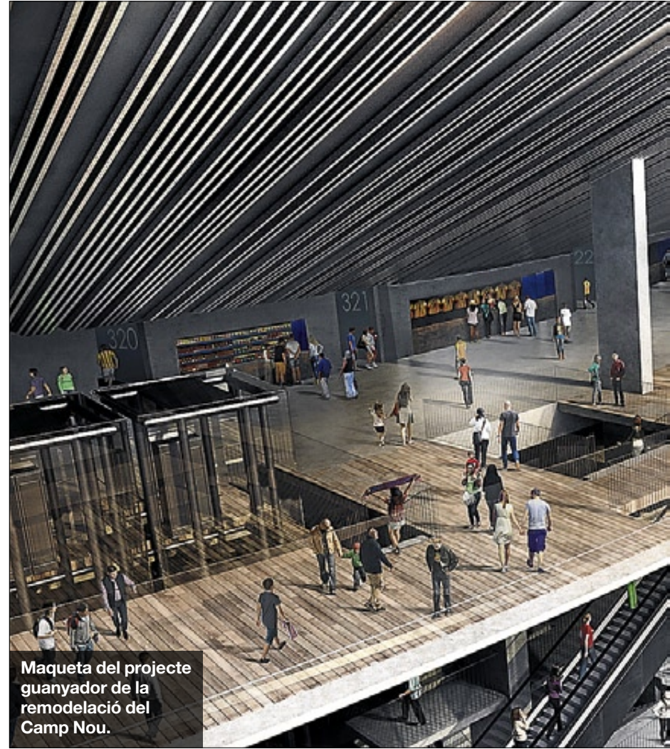
Maqueta del projecte guanyador de la remodelació del Camp Nou.

El club, a més a més, només va informar d'una decisió estratègica amb un impacte econòmic (el pres-