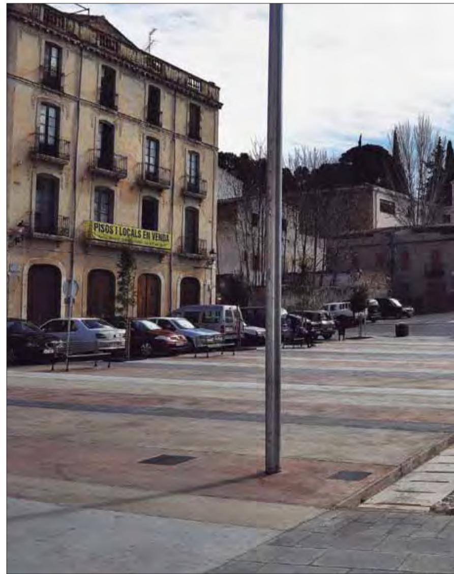
Imatge de diferents indrets del nucli històric de Tortosa que han sigut urbanitzats amb el Pincat: La plaça de la Cinta, l'obertura del barri de Santa Clara i la plaça de Mossèn Sol.